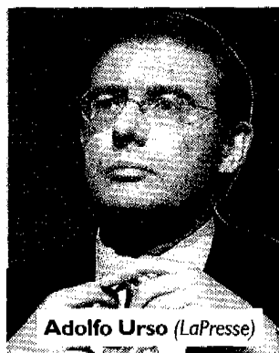
Adolfo Urso