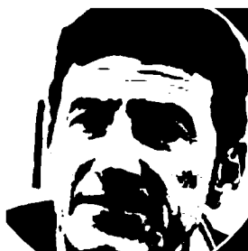
INSIEME Silvio Berlusconi e Giovanni Galli