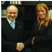
Fabio Berardi e Vittoria Brambilla

[c.s.] Berardi a Roma per la presentazione del Congresso Mondiale del Turismo Sociale che si terrà a Rimini dal 28 settembre al 1° ottobre 2010. San Marino insieme alla Regione Emilia Romagna nel sostenere la candidatura di Rimini e valor aggiunto della proposta, grazie alla sua vicinanza e alle sue prerogative. Iniziative anche a San Marino per ospitare i congressisti. Il Segretario di Stato per il Turismo, Fabio Berardi, ha partecipato oggi a Roma alla conferenza stampa organizzata dalla Regione Emilia Romagna per presentare l'assegnazione a Rimini del World Congress of Social Tourism 2010, il più importante appuntamento mondiale dedicato al Turismo Sociale, in programma dal 28 settembre al 1° ottobre 2010.