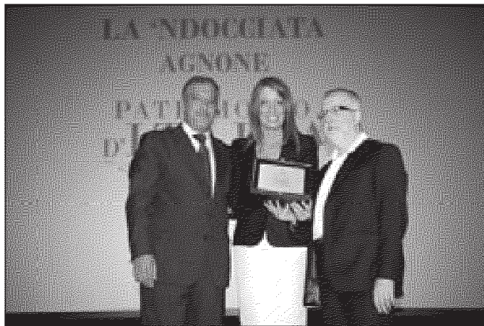
Da sinistra: Marinelli, Brambilla e Attademo

di Vittorio Labanca AGNONE. Il marchio "Patrimonio d'Italia" è una realtà. L'ha presentato il Ministro Michela Vittoria Brambilla . Un marchio che include la Ndocciata di Agnone insieme ad altre 33 manifestazioni nazionali per la tradizione popolare che contribuiscono a valorizzare l'immagine dell'Italia e generare flussi turistici. Un brand che prevede finanziamenti di 1,5 milioni di euro. "L'Italia ha un patrimonio unico e straordinario -ha affermato la Brambilla - Il nostro Paese è da sempre un faro nel mondo per la propria storia, la tradizione, l'arte, la cultura, la creatività, lo stile. Queste eccellenze -ha aggiunto- costituiscono una grande ricchezza che solo l'Italia può vantare. Per questo ho voluto creare un marchio nuovo e prestigioso: "Patrimonio d'Italia" sarà il riconoscimento che ogni anno daremo a queste meravigliose realtà che, nei fatti, si sono candidate ad assumere il ruolo di ambasciatori del nostro Paese nel mondo e che godranno di una particolare promozione anche e soprattutto all'estero, proprio in ra-