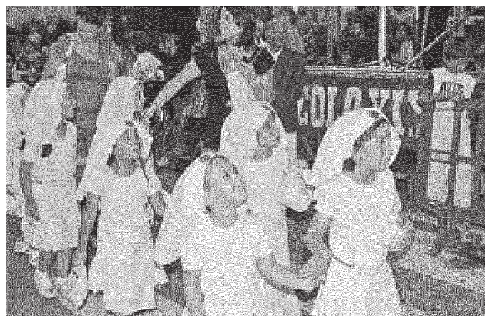
Tante piccole crocerossine al corteo floreale under 10