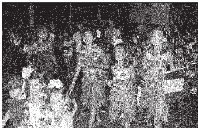
Anche i bimbi della Battaglia festeggiano l'Unità d'Italia