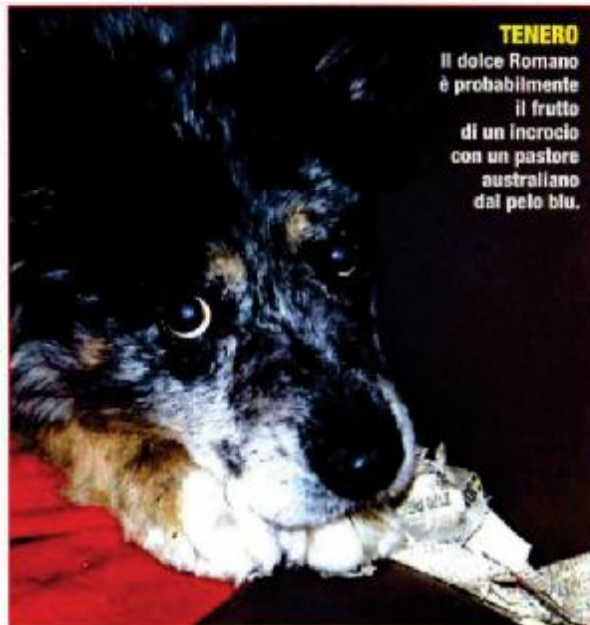
TENERO Il dolce Romano è probabilmente il frutto di un incrocio con un pastore australiano dal pelo blu.

Il nostro trovatello non è esattamente giovanissimo, infatti ha dieci anni e si trova nel canile in questione da poco, cioè dalla fine del mese di gennaio. Si è guadagnato la definizione di "cane invisibile" perché ha così tanta paura del mondo e delle persone che, se potesse scappare dal suo recinto, cercherebbe un nascondiglio. Un riparo improbabile dove a nessuno verrebbe mai in mente di cercare un cane: magari potrebbe rifugiarsi su un albero oppure in un tombino, comunque al