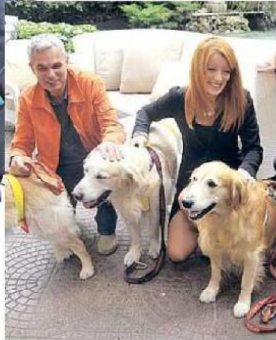
CON FIDO All'incontro al Majestic i relatori hanno portato i propri amici a quattro zampe