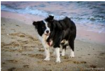
SETTEMBRE 22, 2014 CIAO MALLORY