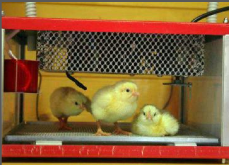
Pulcini troppo gracili per diventare polli, schiacciati come uva

Indietro | Stampa | Invia | Scrivi alla redazione | Suggerisci ()