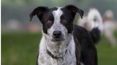
Cane meticcio

Conferenza stampa a Milano di Michela Vittoria Brambilla che contesta il divieto di accesso alla mostra per i quattrozampe e si augura ci sia spazio per la cultura vegana e vegetariana