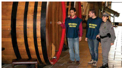
Controlli della Forestale

Dettagliata interrogazione di Michela Vittoria Brambilla che definisce "criminale" il progetto. Confuse rassicurazioni del ministro Martina