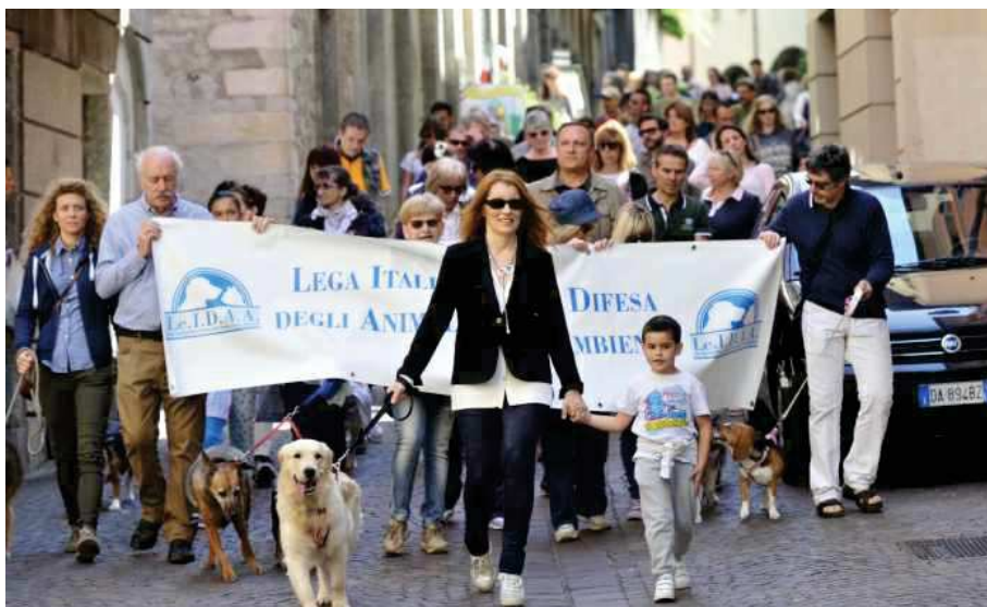
L'on. Michela Vittoria Brambilla, presidente della Lega Italiana Difesa Animali e Ambiente