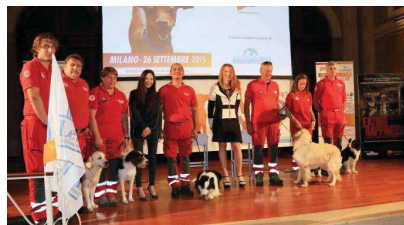
Un momento della premiazione dei cani eroi con Michela Vittoria Brambilla

Lo chiede una petizione presentata da Michela Vittoria Brambilla presidente della Lega italiana per la Difesa degli Animali e dell'Ambiente in occasione del primo Dog Lovers Day