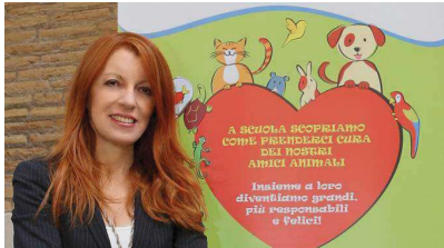
Onorevole Michela Vittoria Brambilla presenta l'iniziativa 'Cuccioli amori'

Si tratta di un percorso didattico dedicato ai bambini, agli insegnanti e ai genitori. Un'iniziativa che si rivolge ai piccoli di un'età decisiva per la formazione del carattere e della personalità