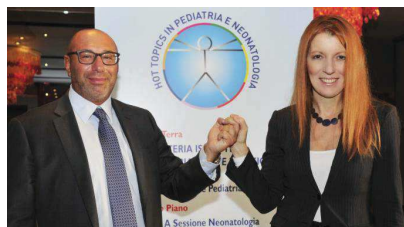
Michela Vittoria Brambilla, presidente della Commissione bicamerale per l'Infanzia e l'Adolescenza

Aprirà al Fatebenefratelli grazie al protocollo firmato col Ministero. L'On. Brambilla: "Meriterebbe di essere un reato autonomo"