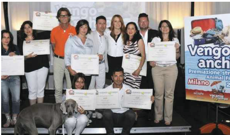
La premiazione, al centro Michela Vittoria Brambilla