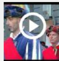
Carnevale di Viareggio, dal primo febbraio sfilano i carri: Renzi star