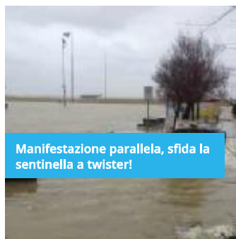
Manifestazione parallela, sfida la sentinella a twister!